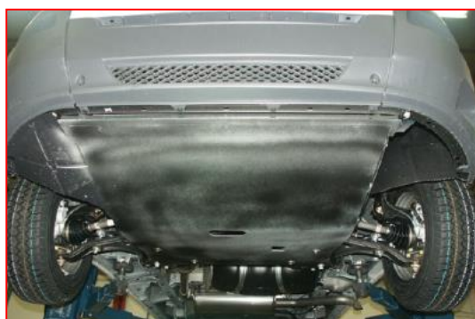
Protections sous moteur et sous caisse