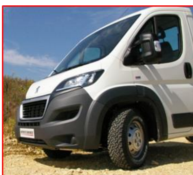
Garde au sol sous moteur améliorée et pneumatiques « M + S »