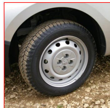
Pneumatiques « M + S »