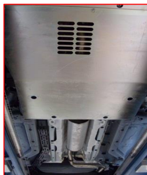
Protection sous moteur