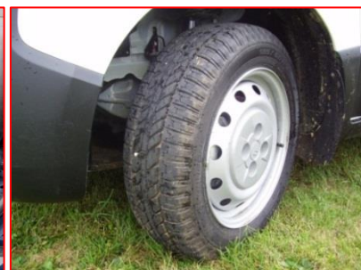
Pneumatiques « M + S »