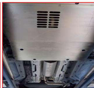
Protections sous moteur