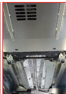
Protections sous moteur et sous caisse