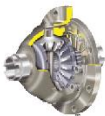
Différentiel à glissement limité