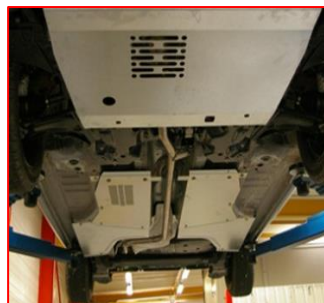
Protections sous moteur et sous caisse