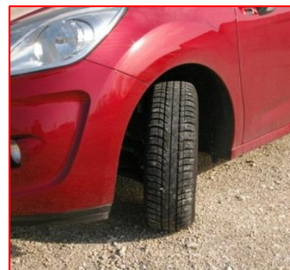
Pneumatiques « M + S »