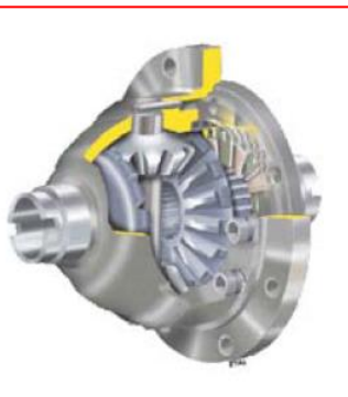
Différentiel à glissement limité