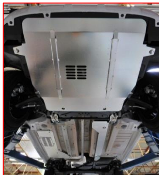
Protections sous moteur et sous caisse